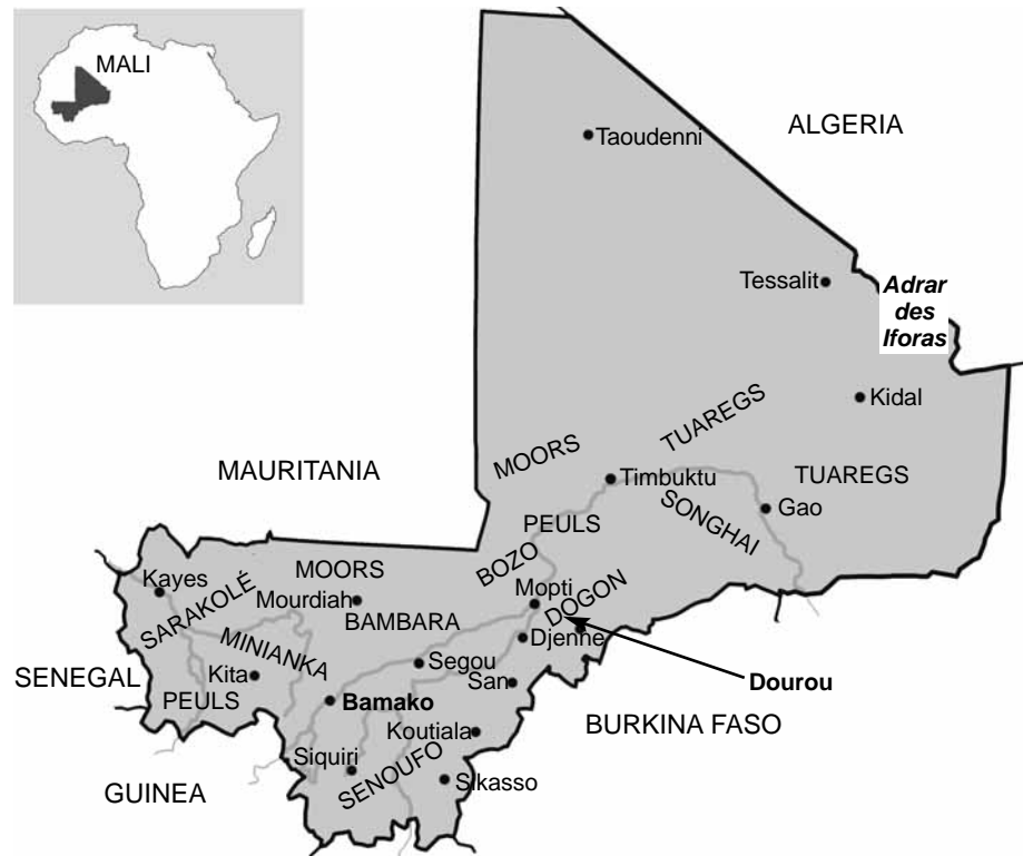
Figure 1.2 Ethnic map of Mali