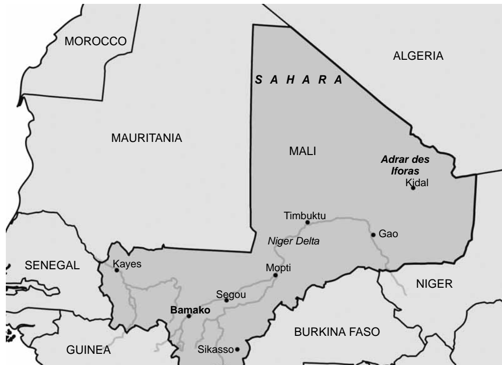
Figure 1.1 Map of Mali with a view of northern regions

Redrawn from: Christian Coulon, Mali, Encyclopedia Universalis (2004).