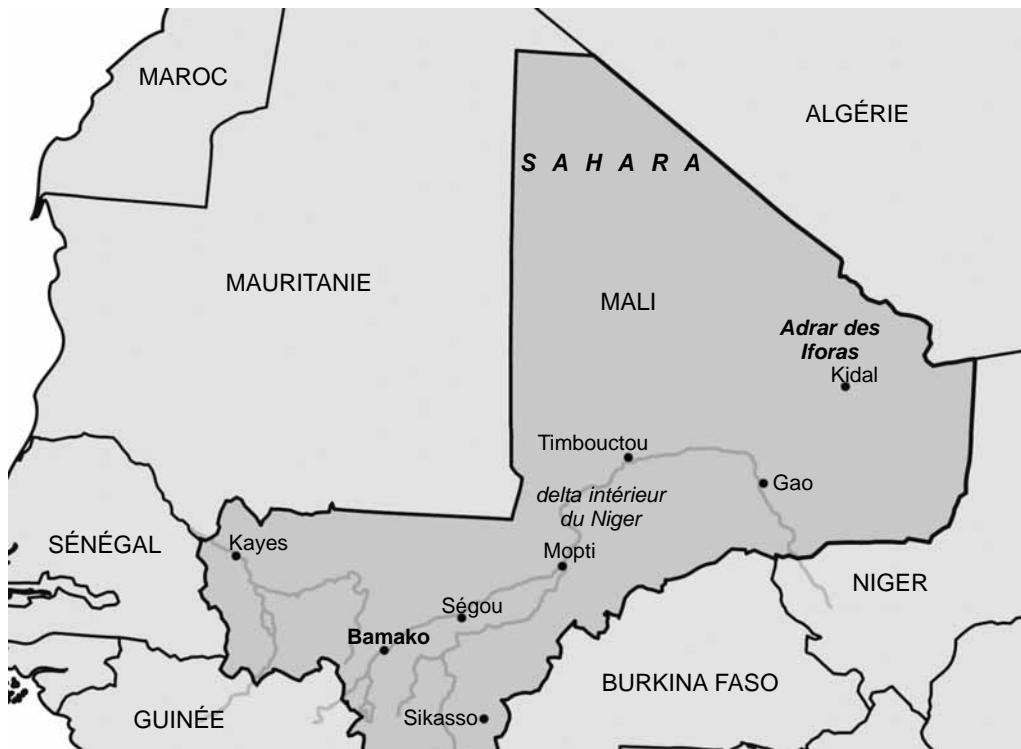
Figure 1.1 : Carte du Mali avec une vue des régions du nord

Redessinée à partir: Christian Coulon, Mali, Encyclopaedia Universalis (2004)