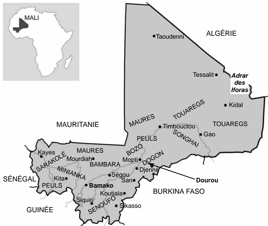
Figure 1.2 : Carte ethnique du Mali